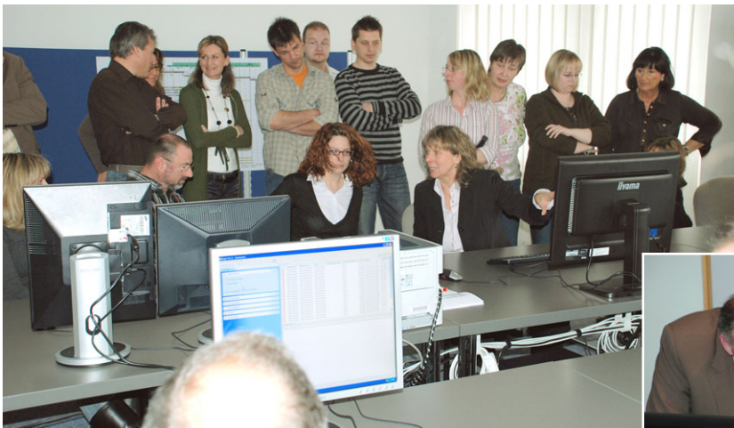
Unter Anleitung der GUSO-Experten aus Düsseldorf und Andernach konnten die Anwender im Andernacher Showroom das neue System an den Geräten ausprobieren.